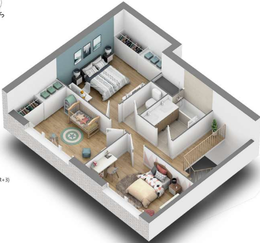
Niveau haut (R+3)