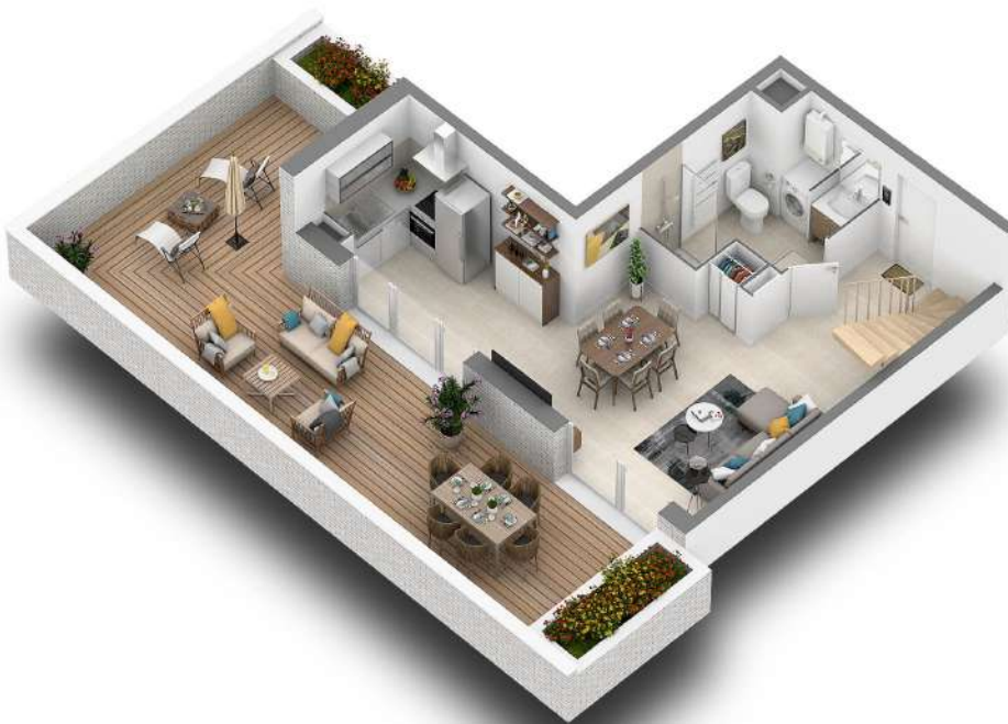
NOTA : Niveau bas (R+2)

Des modifications sont susceptibles d'être apportées à ce plan en fonction des nécessités techniques ou réglementaires lors de la réalisation. Les surfaces indiquées sont approximatives conformément à l'article R261-25 du CCH. Les rebordées, soffites, faux-plafonds, trappes de visite, gaines, canalisations, radiateurs, l'emplacement des équipements et implantations électriques, ainsi que la hauteur sous plafond, la hauteur des seuils et allèges sont figurés à titre indicatif. La hauteur des seuils correspond à la différence de niveau entre les sols finis intérieurs et extérieurs et ne tient pas compte de l'obstacle à enjamber. Les plantations éventuelles ne sont pas contractuelles. L'équipement électroménager et mobilier éventuellement indiqué sur plan n'est pas fourni (hormis ceux décrits dans la notice descriptive).