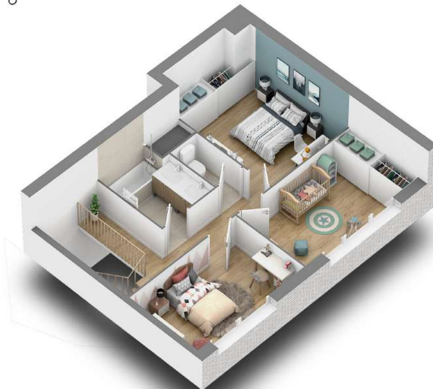
Niveau haut (R+3)