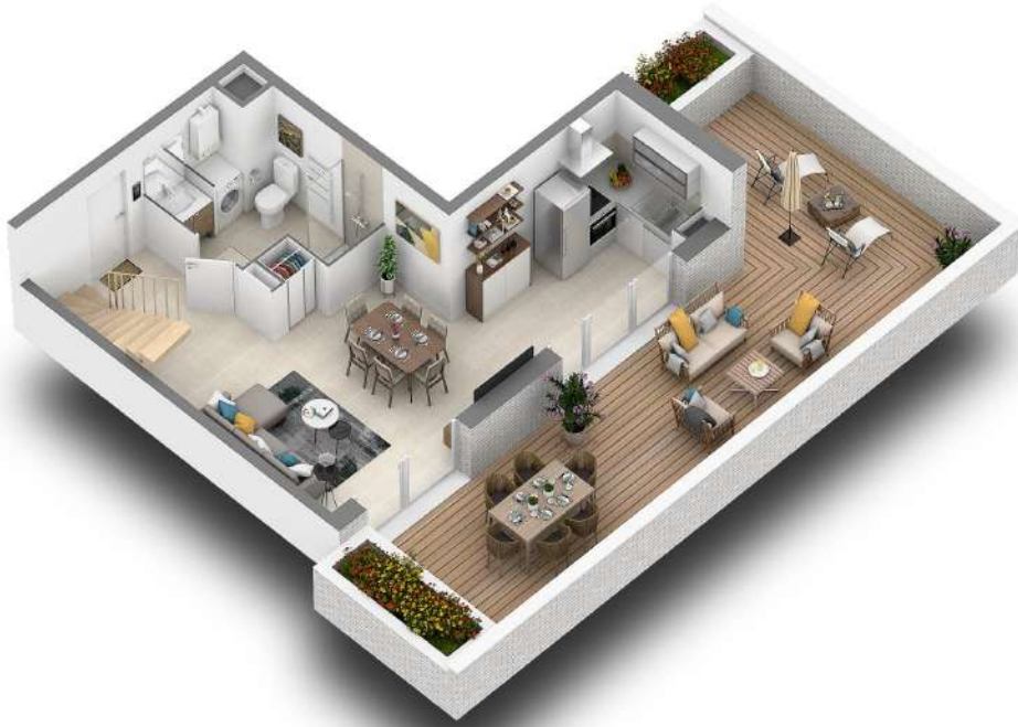
Niveau bas (R+2)